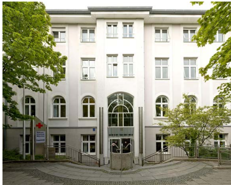
Standort Taxisstraße (Frauenklinik)