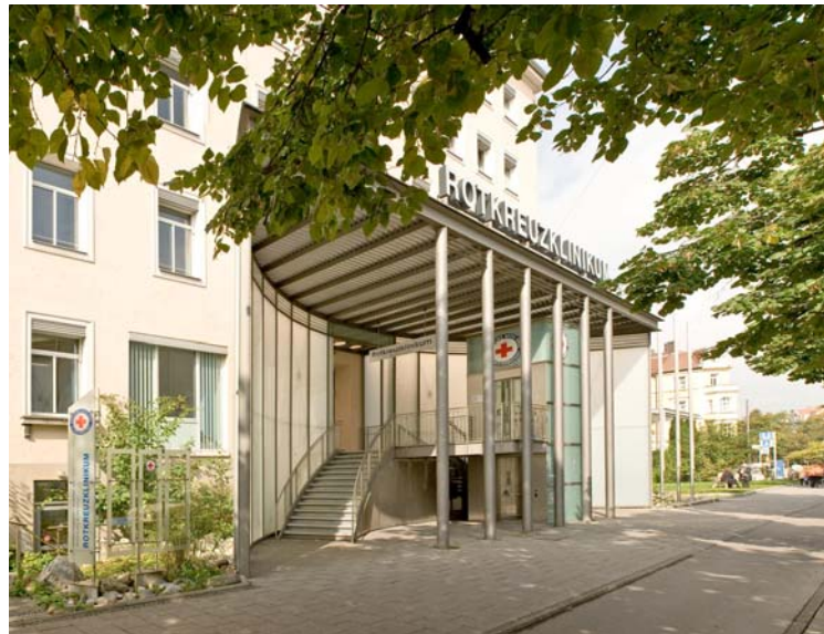
Standort Nymphenburger Straße